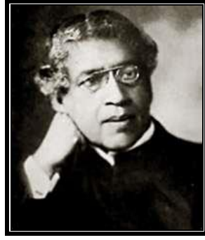
Sir JagadishChandra Bose